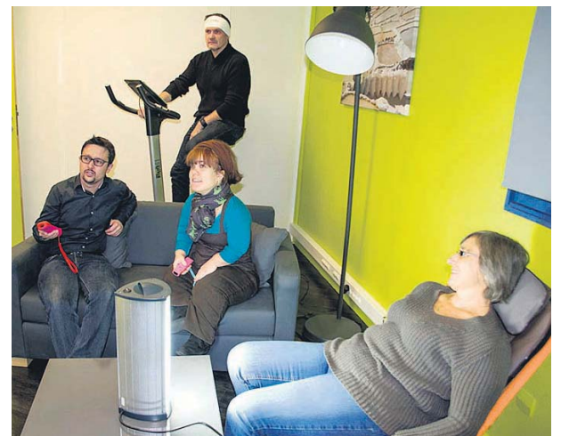
Procès-verbal de comité d'entreprise en braille, remise de prix aux salariés, salle de détente... Au quotidien, Handishare porte une attention toute particulière au bien vivre au travail.